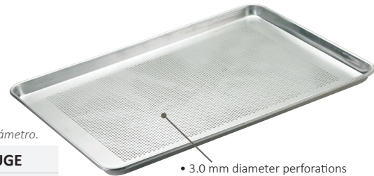
• 3.0 mm diameter perforations