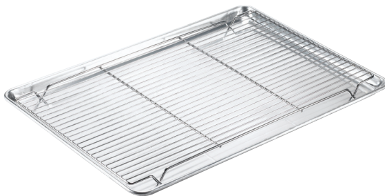
• Perforaciones de 3.0 mm de diámetro.